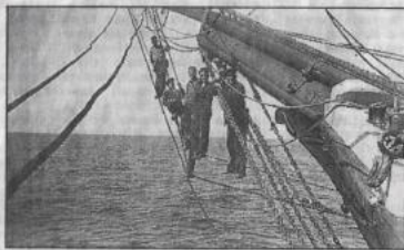
Pojat ottavat aurinkoa.